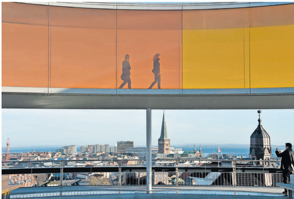
Bunter Blick aus Aarhus: Besucher gehen auf dem Dach des AROS Kunstmuseums durch eine Installation von Olafur Eliasson.

Infos zu Veranstaltungen: www.aarhus2017.dk/de und zum Tourismus: www.visitaarhus.de